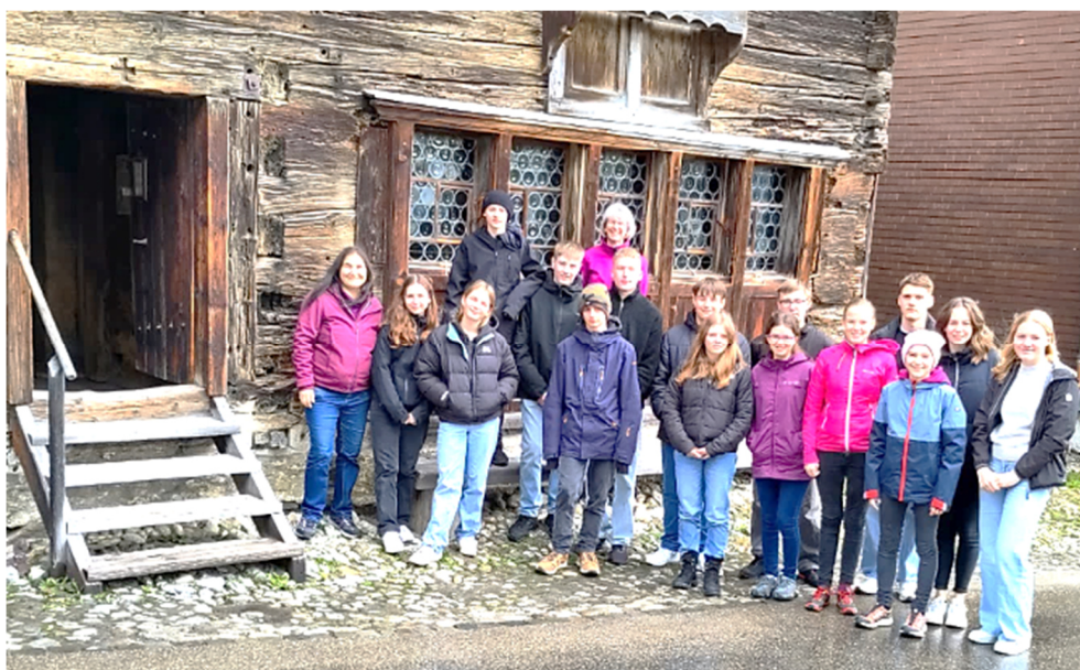
Konf-Weekend 2024. Vor Zwinglis Geburtshaus in Wildhaus.