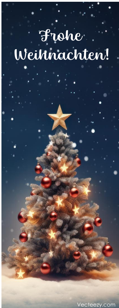
Illustration oben: Feodor Rojankovsky